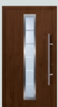
Oberfläche Decograin in Dark Oak

Garagentor und Haustür in Stahl Decograin Dark Oak. Dank der eingepprägten Narbung sieht die UV-beständige Oberfläche nicht nur aus wie echtes Holz (Eiche dunkel), sondern fühlt sich auch so an.