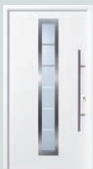
Oberfläche Silkgrain in Weiß

Garagentor in Silkgrain, weiß, Haustür in Aluminium weiß lackiert. Die seidenglatte Oberfläche Silkgrain passt mit ihrer sehr eleganten Wirkung besonders gut zu moderner Architektur.