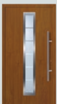
Oberfläche Decograin in Golden Oak

Garagentor und Haustür in Stahl Decograin Golden Oak. Die UV-beständige Oberfläche vermittelt mit ihrer eingepprägten Narbung einen detailgetreuen Holzcharakter.