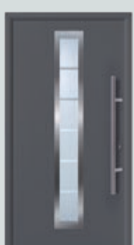
Oberfläche Decograin in Titan Metallic

Garagentor und Haustür in Stahl Decograin Titan Metallic. Die UV-beständige Oberfläche wirkt sehr edel und exklusiv – ähnlich dem Hörmann Farbton CH 703.